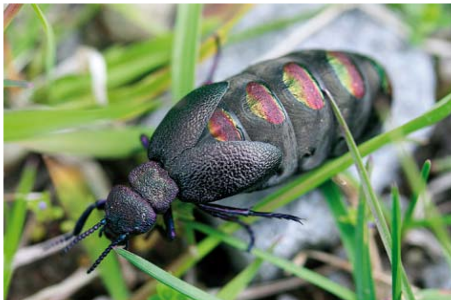
3. Majka duhová ( Meloe variegatus ) dnes žije hlavně v jižní Evropě, severní Africe, na Blízkém a Středním východě. Její historický výskyt je ale doložen i ze severní Evropy a Anglie. U nás je vyhynulá, ale před půl stoletím žila například na Třeboňsku nebo jižní a střední Moravě.

České údaje můžeme porovnat s červenými seznamy území srovnatelné rozlohy. Z denních motýlů, rovnokřídých, vosovitých a včelovitých blanokřídých vymřelo v Bavorsku, Porýní-Vestfálsku a Šlesvicku-Holštýnsku 8–12 % jejich celkového druhové-