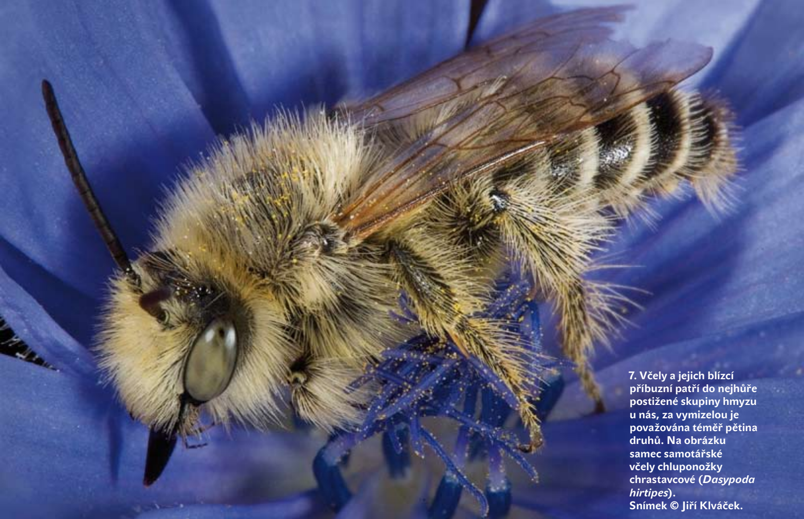
7. Včely a jejich blízcí příbuzní patří do nejhůře postižené skupiny hmyzu u nás, za vymizelou je považována téměř pětina druhů. Na obrázku samec samotářské včely chluponožky chrastavcové ( Dasypoda hirtipes ).

posledních zhruba 100 let zmizelo přes 40 % všech druhů denních motýlů. A to je kaňon Vltavy dodnes jedním z přírodně nejbohatších míst v jižních Čechách.