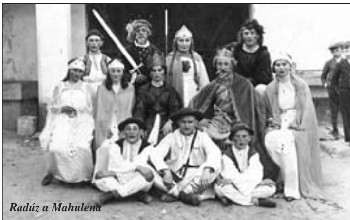
Radúz a Mahulena