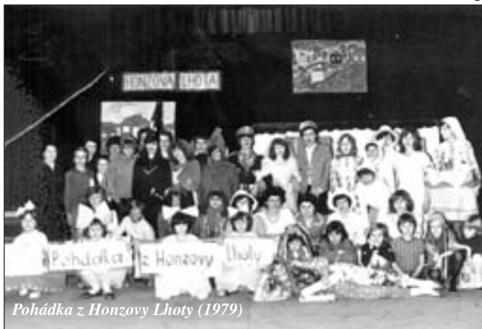
Pohádka z Honzovy Lhoty (1979)