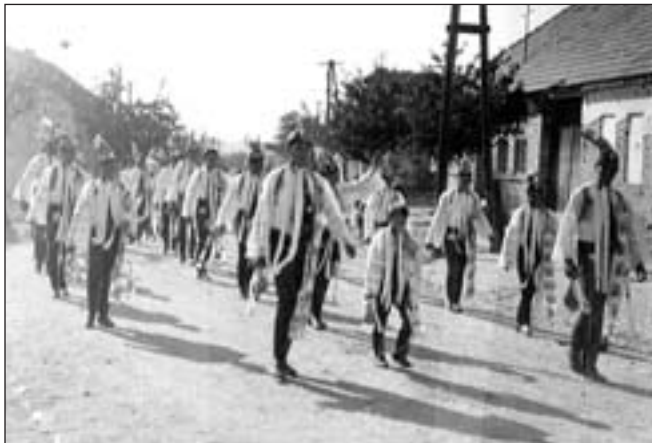
Průvod od stárka (1948)

V pondělí bude změna. Protože není druhý stárek, zkusíme to udělat jako v okolních obcích. Ve 14 hodin půjde průvod celé chasy, tj. šohajů i děvčat, pro starostu, od starosty se půjde na faru a potom pod máju. Samozřejmě, že chceme, aby v průvodu šly děti v krojích nejen z Lanžhotčánku, ale i ostatní, které mají kroje. Byli bychom rádi, kdyby se zúčastnili i muži a ženy v krojích. Tímto