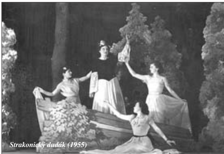
Strakonický dudák (1955)