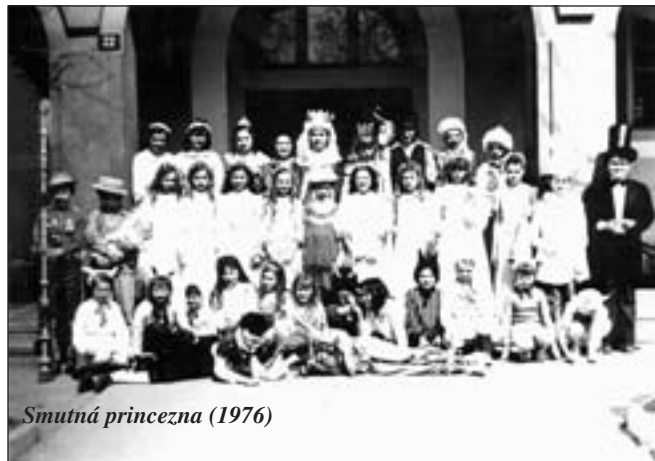
Smutná princezna (1976)