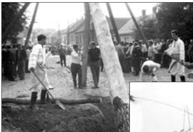
Stavění máje u Vedralů (1970)