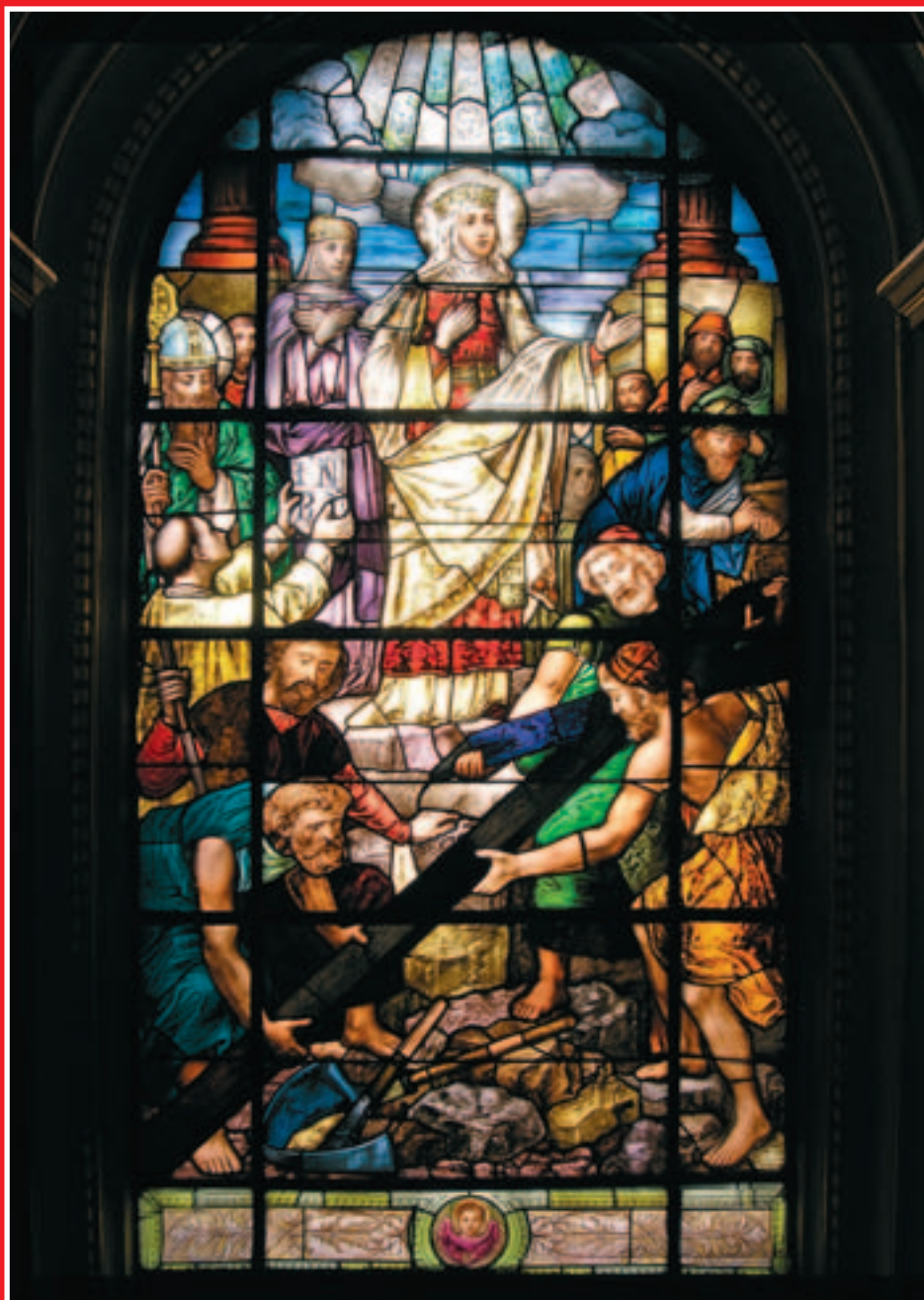
Nalezení sv. Kříže