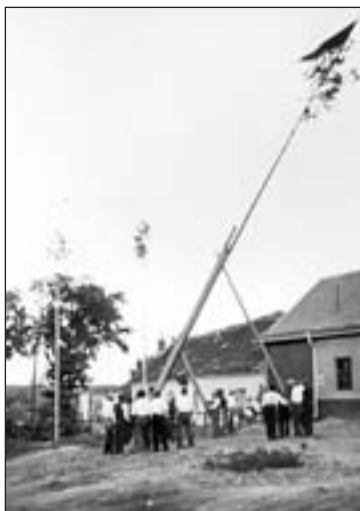
Stavění máje u Lamberků